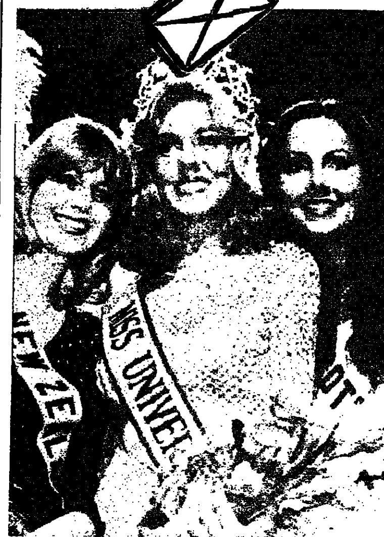
سئول : فازت ملكة جمال الولايات المتحدة الانية شيون ويثري بلقب ملكة جمال العالم في المباراة النهائية التي جرت في سئول عاصمة كوريا الجنوبية ليلة الثلاثاء ، وتبلغ الانية ويثري العشرين من العمر وترى في الصورة اعلاه وهي تتوسط وصيفتيها .

وقد اعرب مدير المدرسة عن ارتياحه التام للاقبال الكبير على المدرسة لا سيما بعد ان قطعت شوطا كبيرا من التقدم الذي حصلت على اشهره على اعتراف وزارة المعارف والتثاقفة وعلى العلامة الواوية .